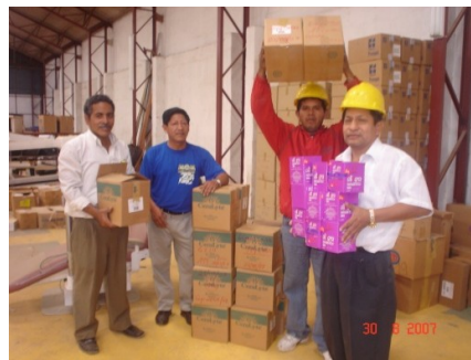
Hospital del MSP de La Libertad