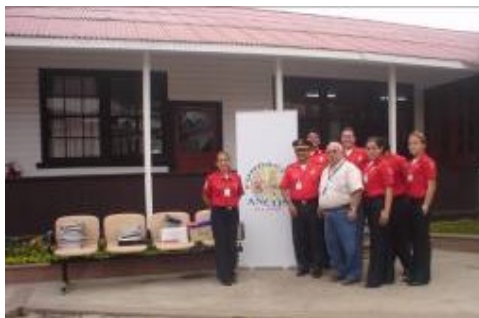
Cuerpo de Bomberos de Salinas